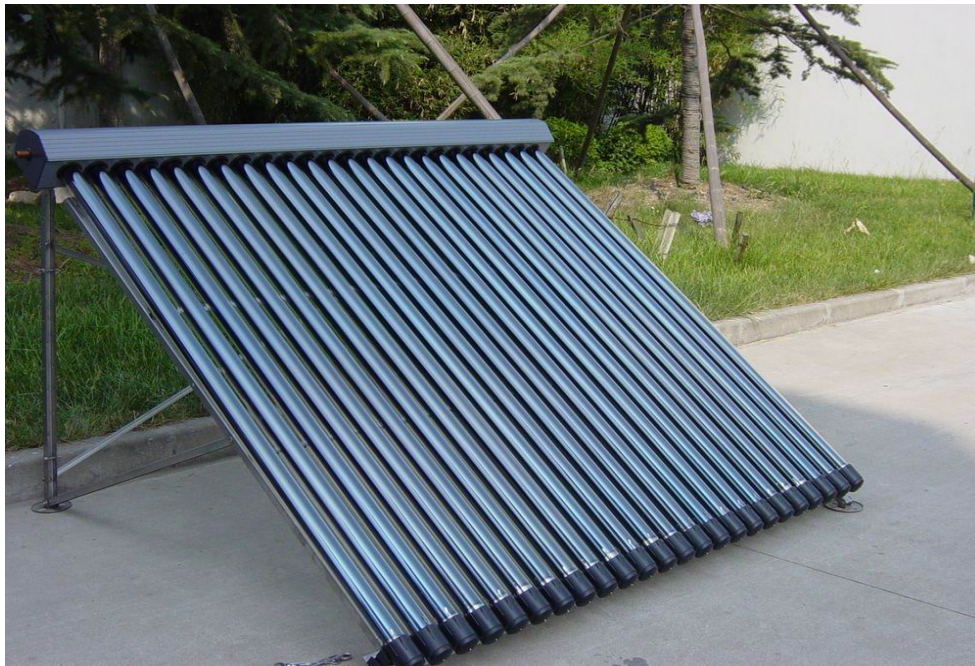
תמונה 2 מראה בתקריב את צינור הזכוכית לדוגמא

בשנים האחרונות פותחו קולטי שמש חדשניים העשויים מצינורות זכוכית כפולים הסגורים בצד אחד כמעין מבחנה גדולה. בתמונה 1 תוכלו לראות קולט שמש כזה.