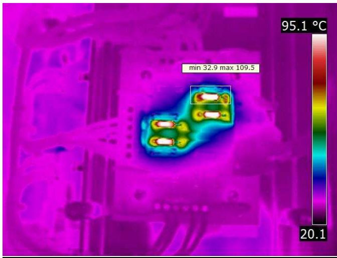
תמונה - 2 (נגד R1 בכרטיס 18E2 בטמפ' 109°C)

במכונה זהה לזו היה "אירוע", שבו נשרף כרטיס זהה לזה שצילמנו. הכרטיס אז כל כך נחרך, ואף העלה עשן תוך כדי עבודה. עם ההבנה המלומדת הזו, בסיומה של הסריקה כולה, כולל בחדר הנקי, ביקשנו מהוונדור של המכונה להפסיק מתחים ללוח המכונה. דרשנו ממנו לבדוק את ההלחמות בכרטיס, וגם את הכבל שמתחבר אליו מהמכונה, שבחדר הנקי, ועד לאזור הכרטיס שבלוח הנבדק. באותו היום הספקנו ליצור את הדו"ח הראשוני, שהכיל את התמונה הראשונית עם כל הפרטים הרלבנטיים עבורה. דו"ח זה נשלח אל מהנדס המכונה לצורך ידיעתו על הממצא החמור, וכדי שיהיה לו זמן להיערך להמשך הטיפול.